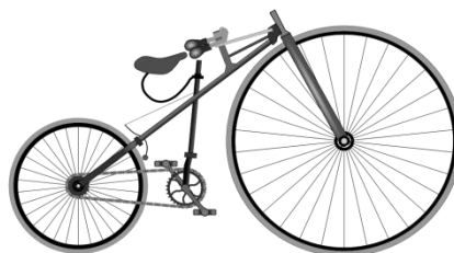
Bicyclette de Lawson

1879 : bicyclette à propulsion par transmission par chaîne et pédaler sous le cycliste